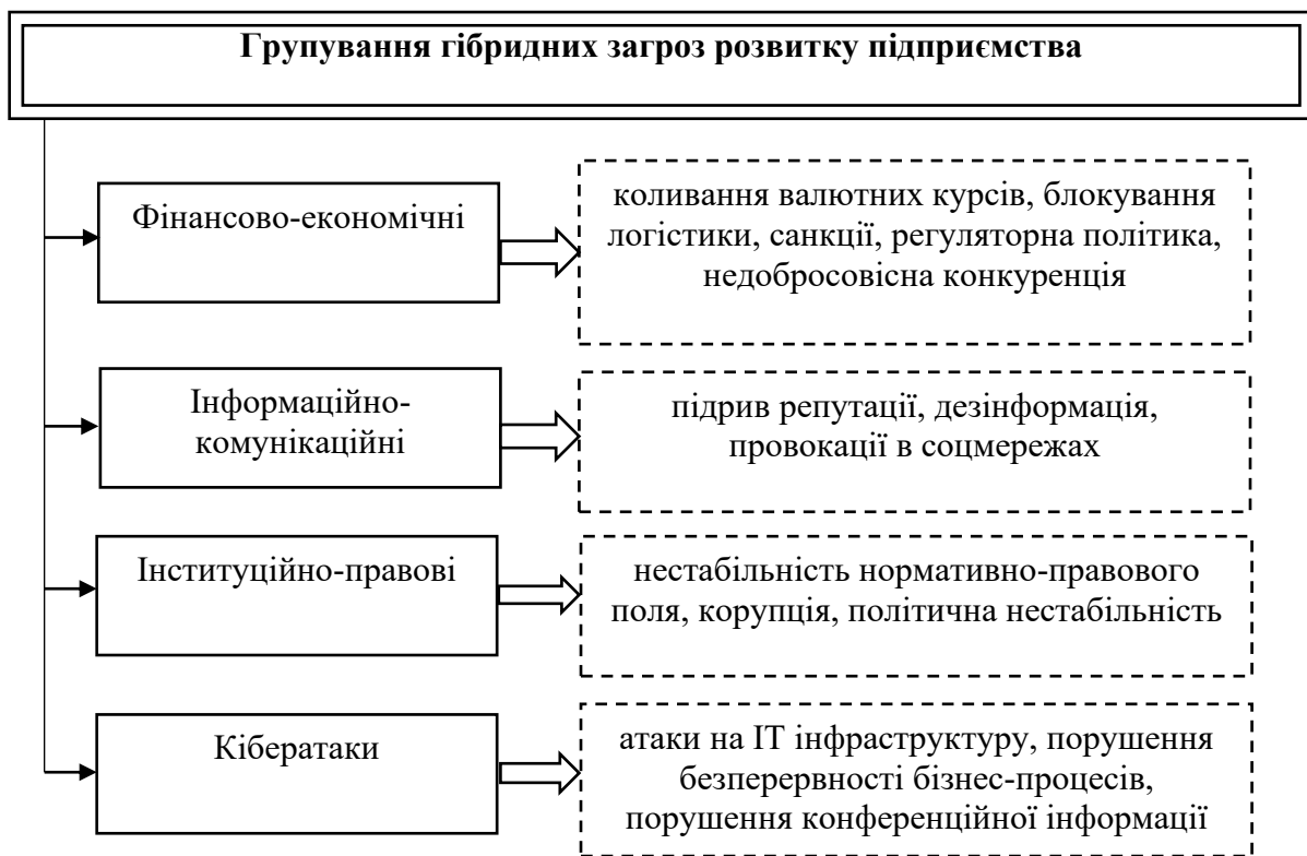
Рисунок 1 – Основні групи впливу гібридних загроз розвитку підприємств

Узагальнено гібридні загрози стратегічного розвитку підприємств можна поділити на певні групи (рис. 1).