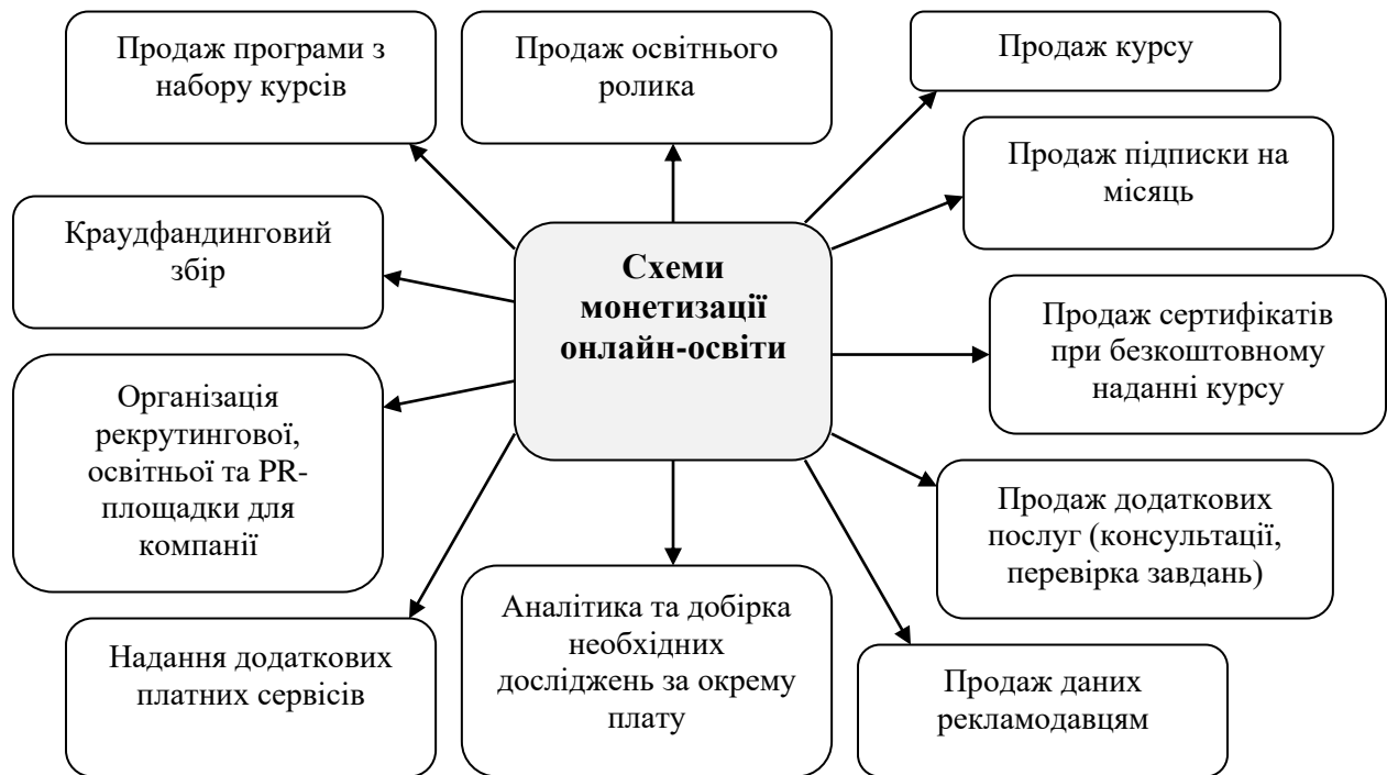
Рисунок 4 – Існуючі схеми монетизації проектів онлайн-освіти

– низький відсоток споживачів, що сприйняли освітню послугу у повному обсязі. Кількість здобувачів, що закінчили повний онлайн-курс навчання, особливо, якщо він є безкоштовним становить лише біля 15%. Для платних освітніх онлайн-платформ такий показник становить біля 45 %;